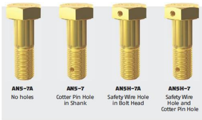
Figure 2: Safety wire and cotter pin holes.