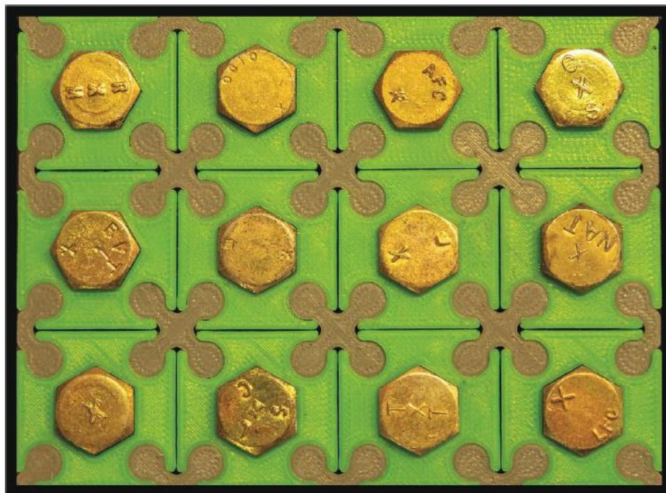
Figure 4: AN5 bolts from various manufacturers.

La X in rilievo o stampigliata sulla testa del bullone è l'elemento primario per l'identificazione del bullone AN in acciaio. Per i profani, può creare un po' di confusione. Prendete alcuni bulloni AN e vedrete quanti modi di marcare si presentano. Questi identificano i vari produttori (fig. 4). Per questo articolo, abbiamo cercato e trovato in magazzino solo per l'AN5 una dozzina di produttori diversi. Casualmente, abbiamo scelto di eseguire un modello 3D con CS marcato sulla testa.