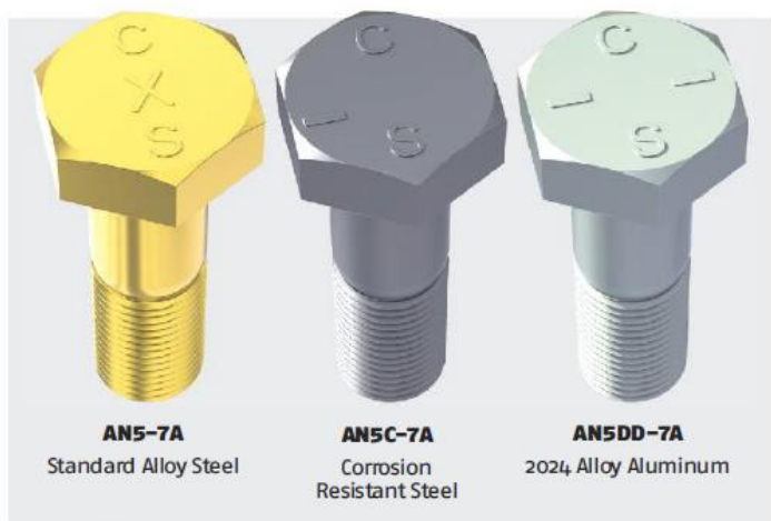
Figure 3: Bolt material composition.

aggiungere una A alla fine del PN (es. AN5-7A). senza la A il bullone avrà automaticamente il foro nel gambo (fig. 2). La seconda modifica è il foro eseguito nella testa del bullone per consentire la frenatura con il filo di sicurezza. L'aggiunta al PN ha un po' più di senso, aggiungeremo semplicemente una H dopo il PN principale, ma prima del dash (per esempio AN5H-7A).